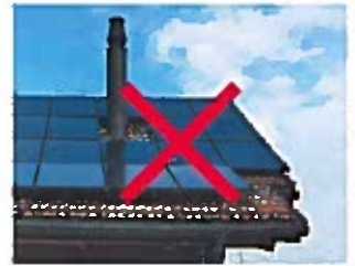
Schéma A 1

points d'ancrage et/ou ligne de vie réf (art. 32.1 et 2 OTConst)