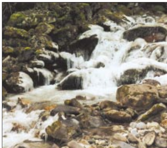
Maîtriser l'eau pour demain

La maîtrise de l'eau est un défi pour tous les pays. Nous qui ne connaissons pas de problèmes d'alimentation devons être très sensibles à la valoriser.