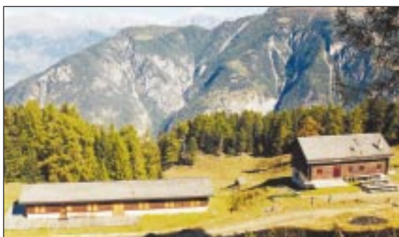
L'alpage de Sigeroulaz

Le projet consiste à créer un parc d'activités suspendu dans les arbres, avec une dizaine de sites de jeux, sur une surface globale de 15 ha environ, constituée de pâturages boisés. Près de 100 activités pourraient être proposées, sous la forme d'un cheminement progressif de parcours successifs à difficulté croissante. Chaque parcours comprendrait des activités différentes notamment: