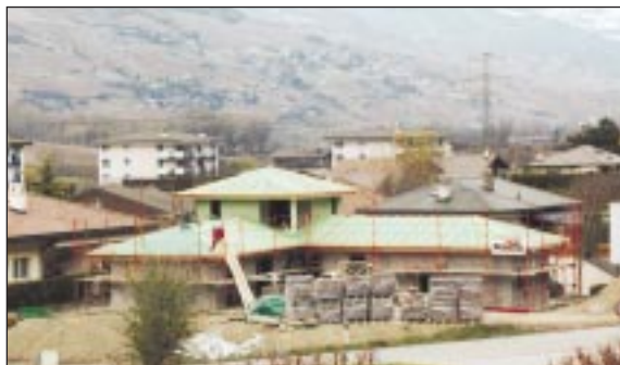
Emoluments revus pour le traitement des dossiers de construction

La loi sur les constructions permet aux communes de facturer les frais administratifs nécessités par le traitement des dossiers. En outre, avec l'introduction de la mensuration fédérale, le relevé des bâtiments doit nécessairement se faire par le géomètre conservateur.