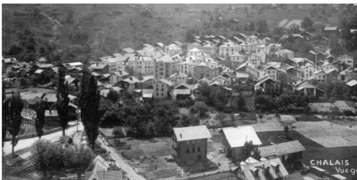
Il était une fois la commune...

Dans notre budget 2002, le Conseil a prévu un montant qui permettra de régler les dernières expropriations de terrain ainsi que des frais d'études complémentaires que nécessite cette importante réalisation. Rendez-vous en juin ou en décembre 2002 au plus tard. Le projet d'ensemble sera présenté à l'une ou l'autre de ces assemblées primaires avec la demande de crédit correspondante.