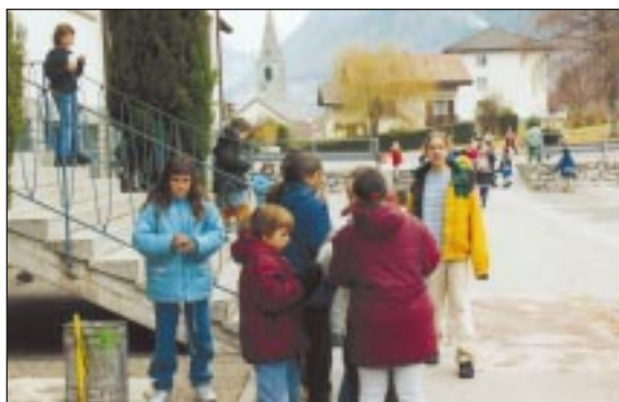
La sécurité des enfants: un souci permanent

Ce dossier a été évalué en fonction de nos obligations légales et au regard également de la pratique instaurée et préconisée par le Département de l'Education, de la Culture et des Sports.