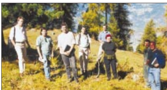
Vision locale pour le projet Parc Aventure à Sigeroulaz

Un parcours pour enfants (7 à 12 ans) y est également prévu avec un mini-parcours, style jardins d'enfants pour les 3 à 6 ans.