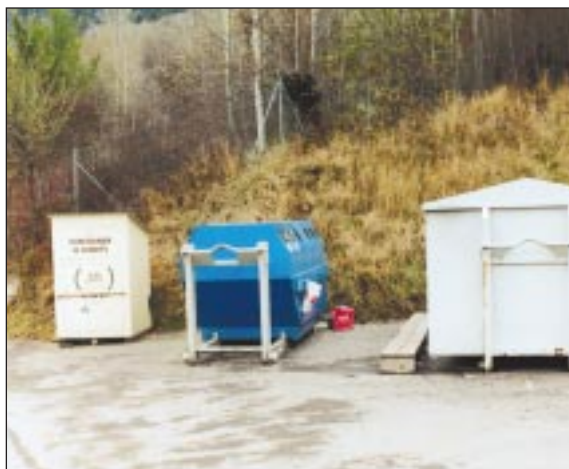
Un container à habits à l'entrée des déchetteries

Il a été décidé d'offrir la gratuité du service des déchetteries eu égard au faible montant qui est encaissé. En revanche, les déchets professionnels devront être évacués directement à l'UTO, sous réserve des végétaux.