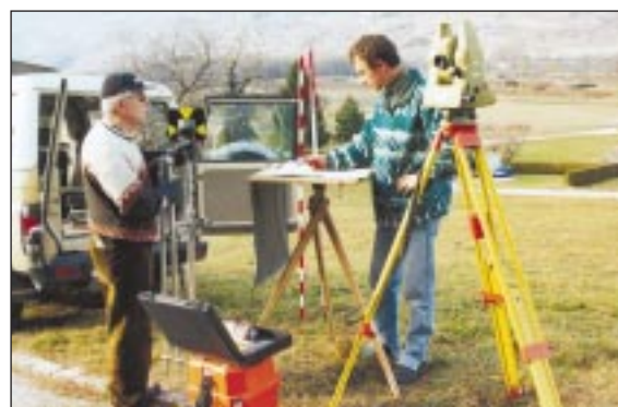
Relevé géométrique pour toutes nouvelles constructions