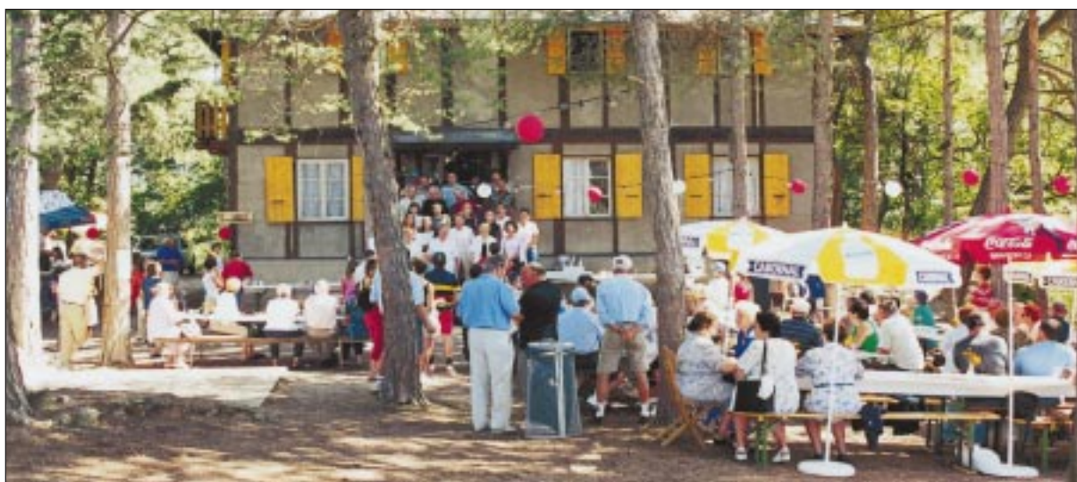
Le 15 août à Briey: une belle fête patronale.

Reste à accepter le cautionnement solidaire exigé par le Crédit Suisse pour un montant de Fr. 720'000.- Les autres cautions de ce compte sont les communes de Sierre, Lens et Grône.