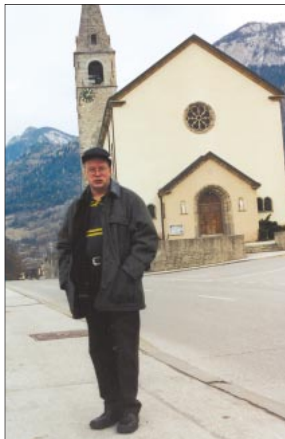
Notre révérend Curé, serein malgré l'administration des 2 paroisses