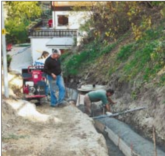
Travaux à la route du Désertet