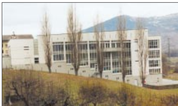
Home de Chalais, septembre 2001, 10 ans déjà.