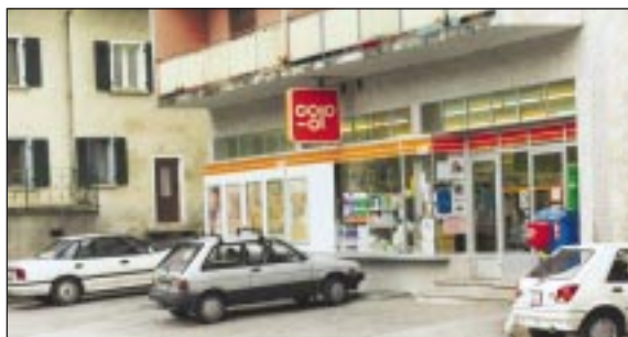
Coop: contrat prolongé d'une année.