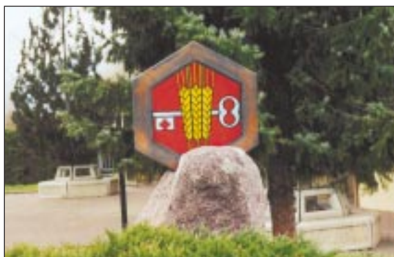
75 ans en 2002 de la Raiffeisen et un soutien appuyé aux sociétés locales