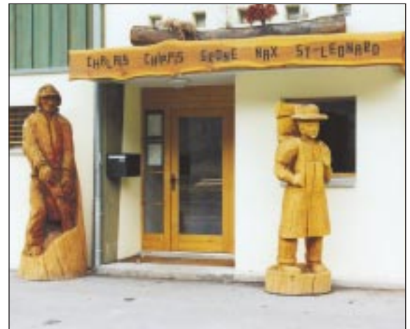
Le triage forestier: une entrée accueillante