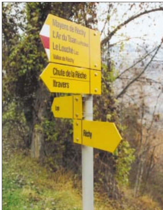
Une signalisation pédestre entièrement actualisée