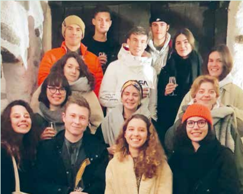
Les contemporains-nes de la classe 2001, réunis à la Maison Bourgeoise de Chalais, à l'occasion de leur promotion civique