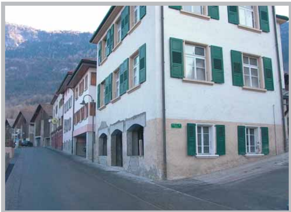
Bâtiment La Forge en rénovation.

Notre situation est excellente dans la mesure où nous pouvons persister dans une politique d'investissements soutenus et contenir la dette dans des situations financières fort acceptables.