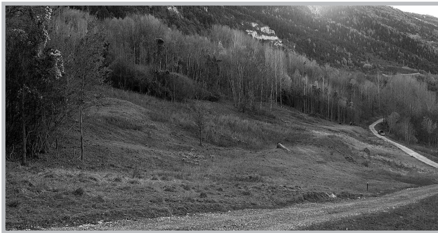
Zone agro-touristique de Zamplan-Crétilon.

Plusieurs variantes de solutions ont été examinées. Il ressort que le projet retenu répond aux exigences fédérales et cantonales en