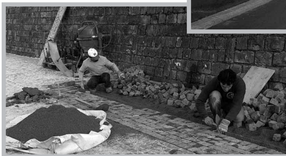
Pose des pavés au pied de la Tour.