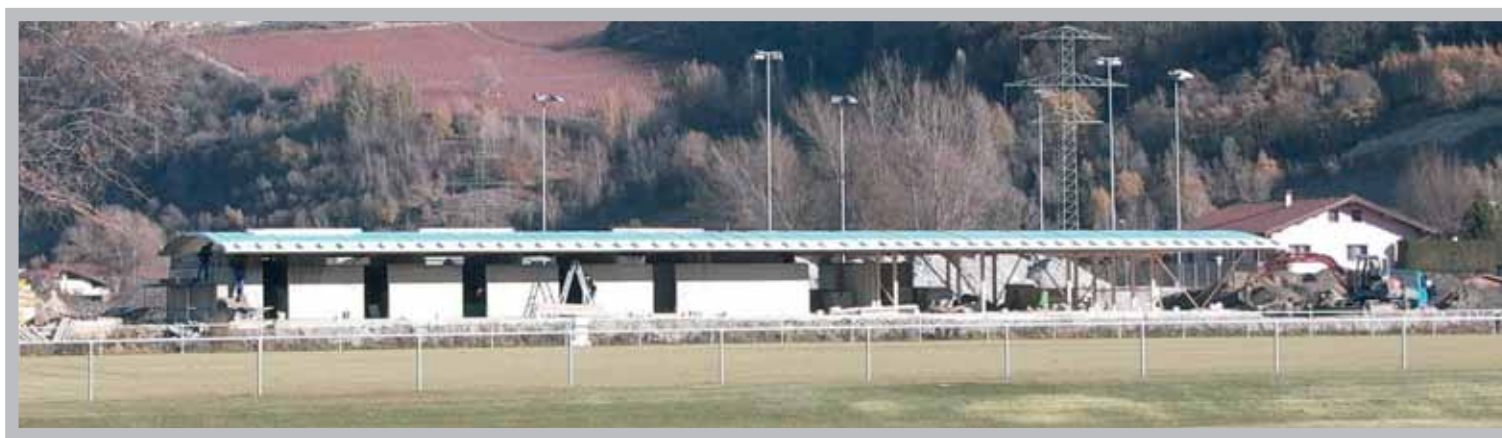
Les futurs vestiaires du FC Chalais - Zone sportive de Bozon.

Dans les années à venir, il ne faudra pas s'attendre à voir ces taxes diminuer.