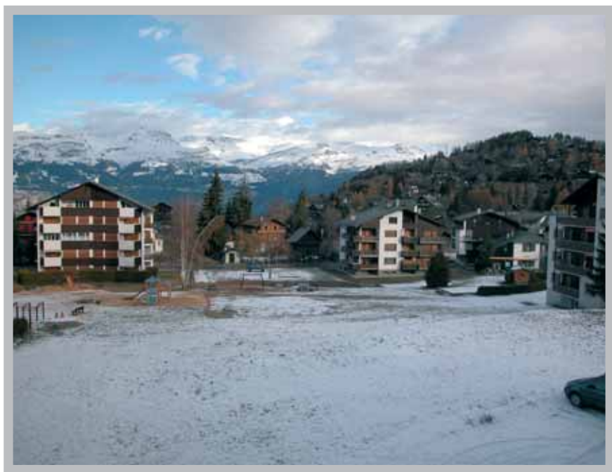
Place de jeux - zone Avouintsettes.