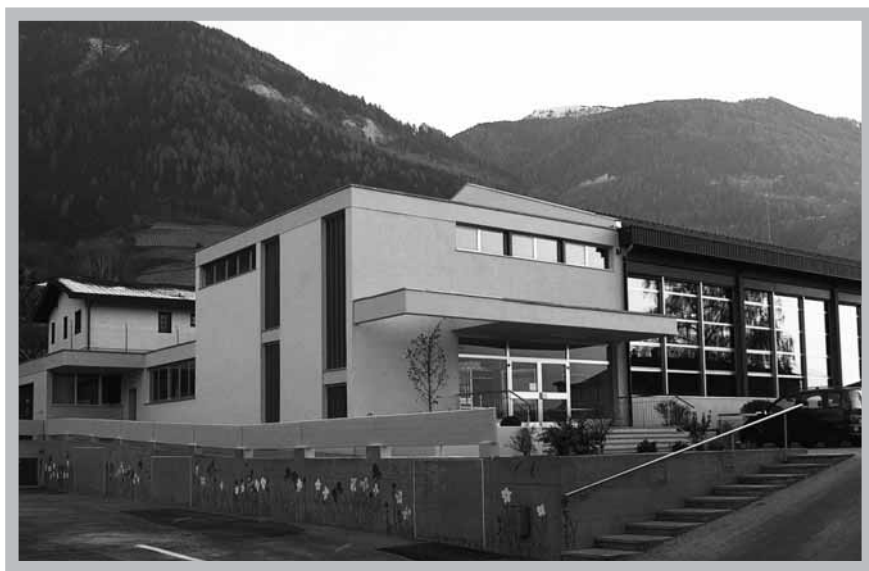
Salle polyvalente de Chalais après sa restauration.

En matière d'équipements, nous avons l'obligation de construire des routes de quartier, en amenant également les conduites industrielles nécessaires. Même si la contribution des tiers est importante avec l'appel en plus-value, il n'en demeure pas moins que le sacrifice financier de la Commune est important. Route des Harroz, route sous l'Eglise,