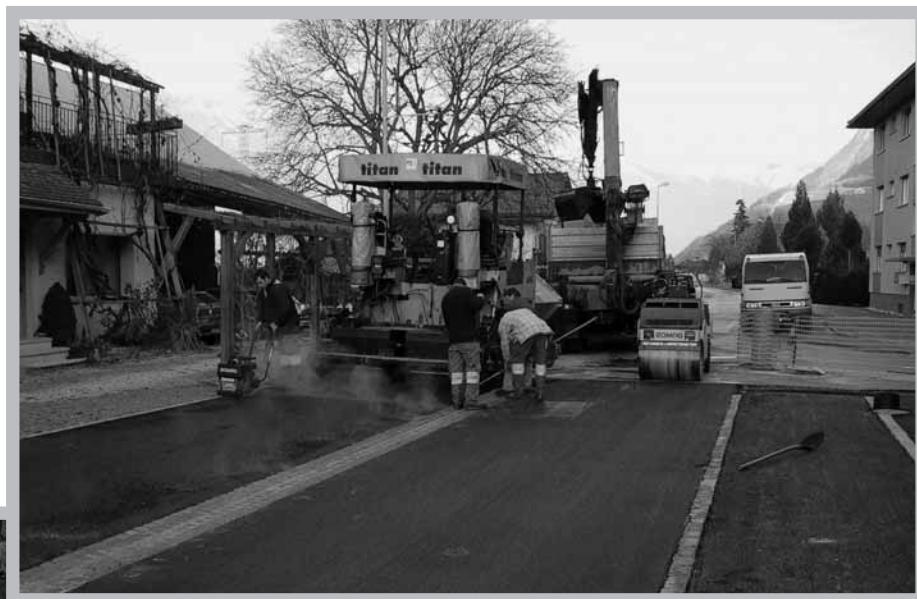
Pose du bitume à la rue du Téléphérique ce 6 décembre 2004.