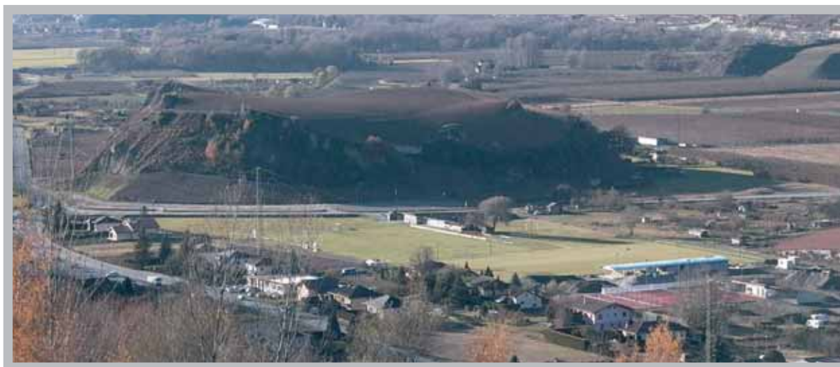
Vue d'ensemble de la zone sportive de Bozon.

Les réseaux d'eau et d'irrigation nécessiteront de gros investissements.