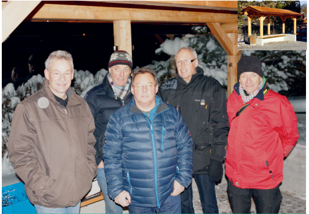
Les promoteurs et constructeurs affichent leur satisfaction du travail accompli

Les jeunes nouveaux citoyens, de la classe 1996, ont été reçus par le Conseil communal, en décembre 2014, pour leur promotion civique