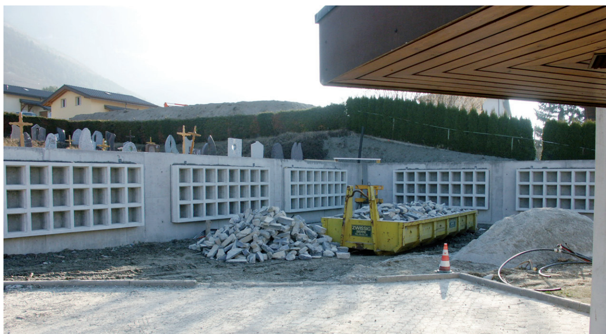
> Les travaux de réalisation du columbarium ont repris. Le projet a déjà de l'allure.