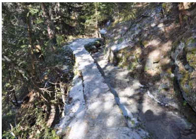
> Passage du mur avant

Les communes ont donc uni leurs efforts en vue de gérer les compensations financières résultant de cette renonciation et de valoriser communément les activités liées au Vallon de Réchy. La Confédération a accepté de compenser ce manque à gagner par le versement d'une indemnité annuelle de CHF 64'487.- pendant 40 ans. Ce fonds est administré par la Commission intercommunale du Vallon de Réchy où chaque commune est représentée.