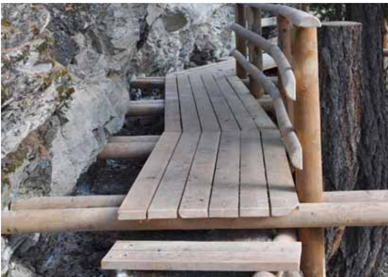
> Passerelle rénovée

La Commune de Chalais a aménagé la place de la Cabane du Bisse par la pose de deux tables