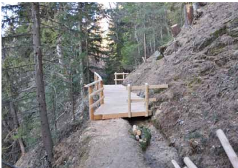
> Passage du mur avec la passerelle

La Commission intercommunale du Vallon de Réchy a décidé de réaliser, entre 2009 et 2010, des travaux d'amélioration de l'accueil et de la sécurisation du sentier reliant la