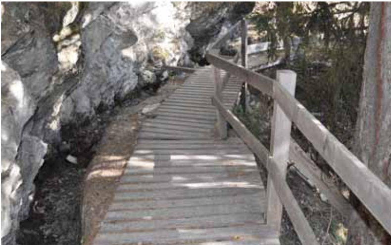
> Ancienne passerelle

Cabane du Bisse à La Lé pour un montant avoisinant les CHF 70'000.– subventionné à 24% par l'Etat du Valais. L'accès au Bisse de Vercorin a dû être fermé lors de ces importants travaux résumés ci-après: