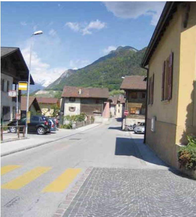
> La Rue Centrale s'apprête à s'embellir

En 2002, nous avons mis sur pied une Protection civile intercommunale avec les communes de Grône, St-Léonard et Chippis. Je croyais à cette organisation et les travaux d'utilité publique effectués jusqu'à ce jour confirment ma conviction. Toutefois, la tendance future va vers la régionalisation et le rapprochement de ces 4 communes vers Sierre. D'où, pour nous, une augmentation considérable des coûts (+ Fr. 4.-/hab.), une perte d'identité de la part de nos