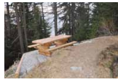
> Nouvelle table

de pique-nique. Dès 2010 une fontaine sera installée afin que les randonneurs puissent se désaltérer après une bonne journée de marche ou remplir leur gourde avec de l'eau fraîche.