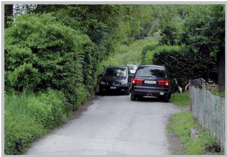
La rue du Fuidjou, trop étroite pour supporter le trafic toujours plus dense généré par la déchetterie.

En conséquence, le Conseil a décidé de proposer à l'Assemblée primaire d'abandonner le PAS, dans le quartier des Zittes, à Chalais, au profit de cette procédure plus simple et tout aussi efficace qu'est le remembrement urbain.