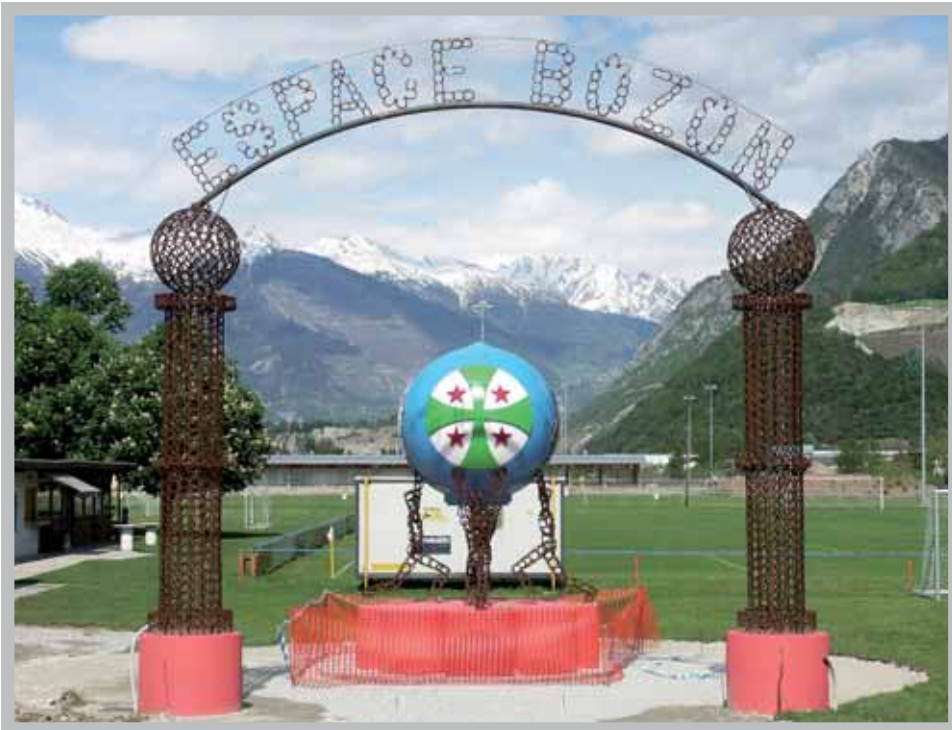
La porte d'entrée de l'Espace Bozon, œuvre de Serge Albasini.