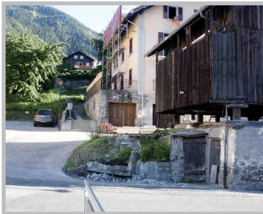
La construction des places de parc privées, pour les appartements de la Forge, va débuter prochainement.

La manière, ainsi que le temps nécessaires à l'analyse et au contrôle de chaque dossier faisant une demande d'autorisation de construire, sont plus que satisfaisants. Pour exemple, les affaires communales sont finalisées dans les quinze jours suivant la mise à l'enquête dans le Bulletin officiel, les cantonales nécessitent un mois supplémentaire environ. Tous les dossiers qui sont déposés auprès de la Commune sont en premier lieu analysés sur leur contenu, c'est-à-dire le contrôle en référence à une checklist communale (3 exemplaires) ou cantonale (7 exemplaires) qui stipule toutes les différentes pièces à joindre au dossier. La Commune met à l'enquête publique au plus tard dans les 30 jours dès réception du dossier complet. Pour les travaux et les modifications de projet de peu d'importance qui ne touchent pas aux intérêts de tiers, il se peut qu'il y ait une abstraction à l'enquête publique. Le requérant est avisé par écrit de la renonciation à celle-ci.