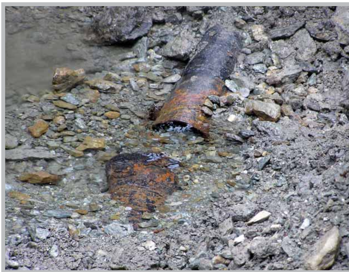
La conduite de captation des Evouettes, déboîtée sous la pression du terrain mouvant.