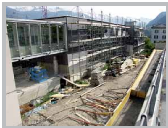
Les travaux de construction de la crèche devront être achevés pour la rentrée scolaire.

Le Conseil communal a décidé de ne pas engager de personnel communal pour gérer ces structures. Il est d'avis qu'une gestion privée ou assumée par un organisme indépendant serait plus efficace et plus dynamique. Les démarches, entreprises dans cette optique, l'on conduit à entamer des négociations avec le Centre médico-social de Sierre (CMS) dont Chalais est membre à part entière. Cette association gère actuellement la crèche commu-