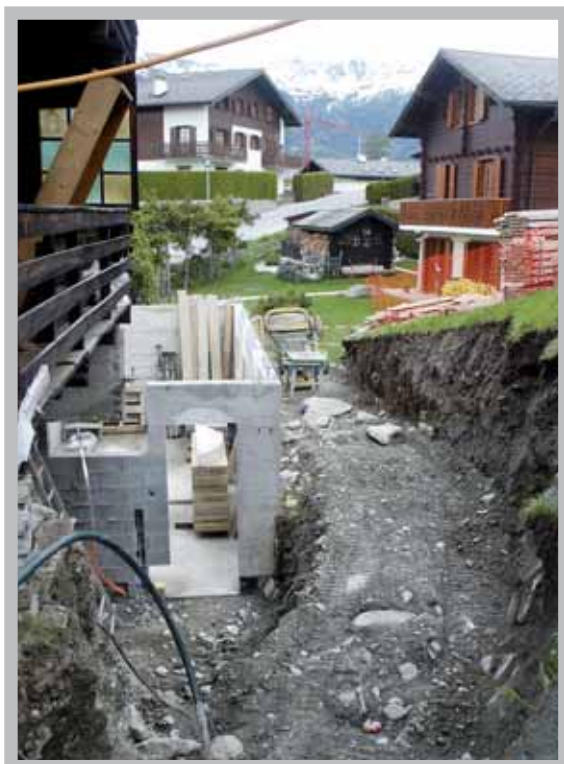
La construction, en plein boom en ce début d'année.

Après un hiver plutôt long et rigoureux, le printemps, quoique encore fébrile, tente de retrouver sa place pour notre plus grand bonheur. Les travaux extérieurs commencent à reprendre du rythme et les chantiers fleurissent à nouveau un peu partout. Depuis un peu plus de trois ans, le Conseil communal encourage tous les propriétaires concernés à opérer un lifting des façades et félicite ceux qui entreprennent ces travaux qui, ne l'oublions pas, sont la première des cartes postales de notre commune. Dans ce but, la Municipalité tente d'apporter sa contribution au renforcement économique des villages, mais également en encourageant la rénovation des bâtisses, elle tente de créer un village accueillant et dynamique. Chacun est par conséquent responsable de l'image plus ou moins agréable qu'elle veut bien présenter.