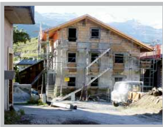
Les vieilles bâtisses se rénovent. Le soutien communal porte ses fruits.