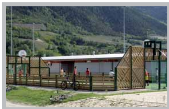
Le terrain multi-sport, à peine installé et déjà pris d'assaut.