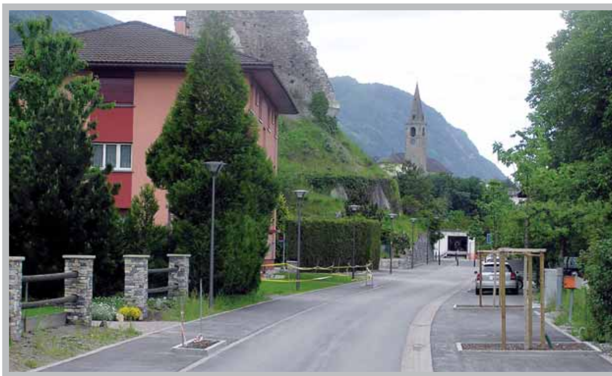
La rue du Téléphérique, bel exemple d'une agréable rue villageoise.

Nous nous sommes attelés au mois d'avril passé à un projet qui, à première vue, ne demandait pas nécessairement de grandes réflexions, mais qui nous a fait vite comprendre qu'il était très délicat dans son approche