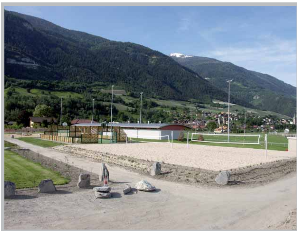
L'Espace Bozon, un équipement qui renforce l'attractivité de notre commune.

Surface de la zone: 60'000 m 2 dont 30'000 m 2 à la Bourgeoisie de Chalais 2 septembre 1992 Requête auprès du Conseil d'Etat pour l'expropriation des terrains 15 janvier 1993 Mise à l'enquête publique des plans d'intentions Admission des recours. Fin de la première procédure 19 juin 1996 Modification du plan de zone de la Commune de Sierre 18 mars 1998 Homologation par le Conseil d'Etat du nouveau plan de zone de 1999 à 2002 Achat de 18'000 m 2 de terrain de gré à gré (25 propriétaires) 18 septembre 2002 Approbation par le Conseil communal du projet d'aménagement printemps 2003 Mise à l'enquête publique du projet 16 décembre 2002 Approbation du projet par l'Assemblée primaire printemps 2003 Début des travaux 2 juillet 2005 Inauguration officielle de l'Espace Bozon