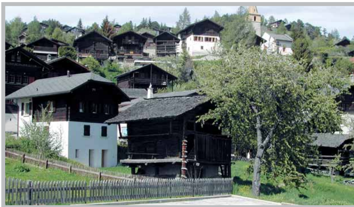
Le village touristique de Vercorin, objet d'intenses réflexions.