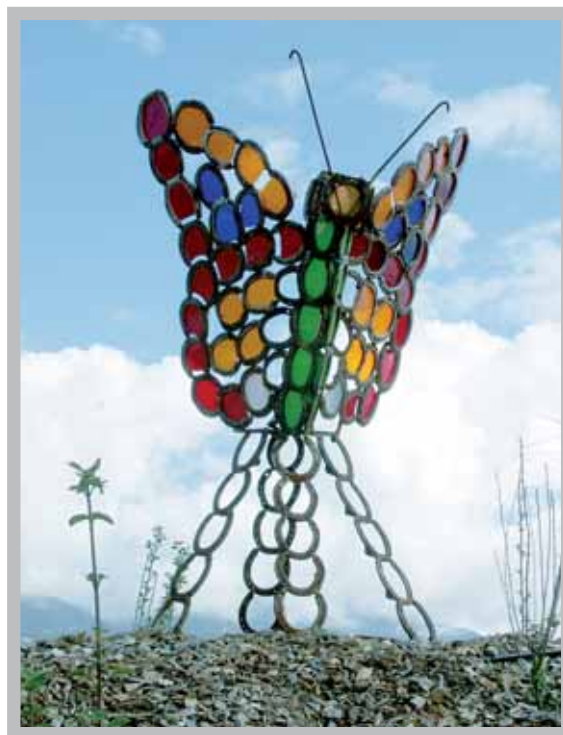
Les papillons prennent leur envol dans le ciel de Bozon.