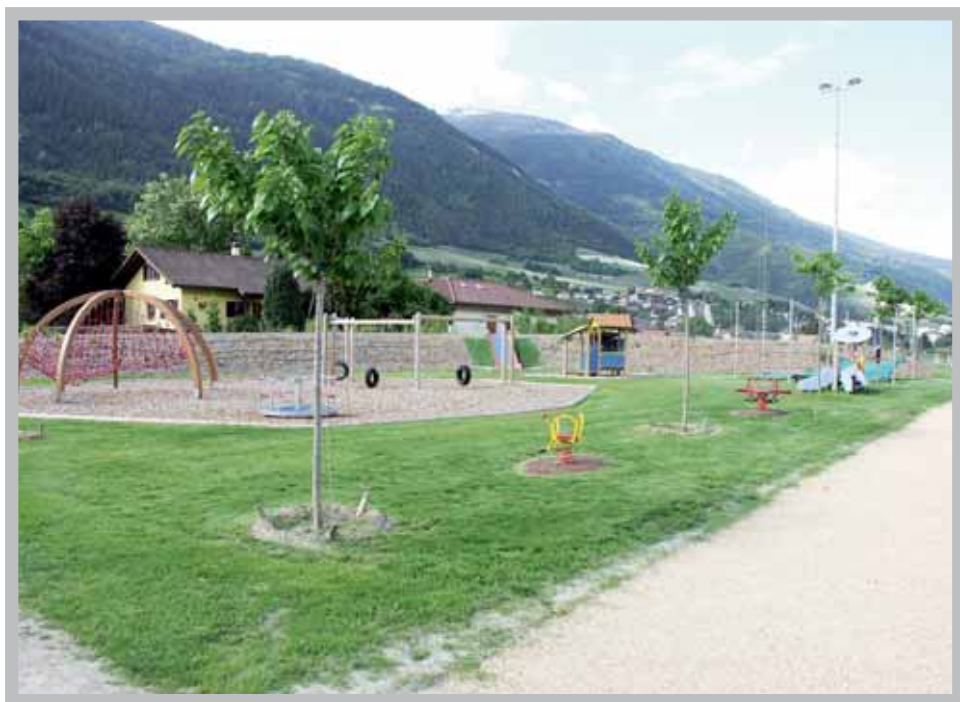
Les tous petits ont aussi leur place dans l'Espace Bozon.