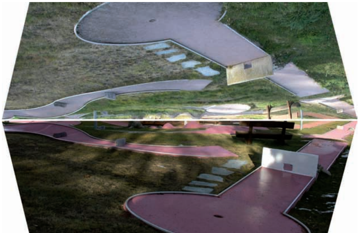
Le minigolf a retrouvé une nouvelle jeunesse, grâce à la «BA des jeunes» (voir page 11)