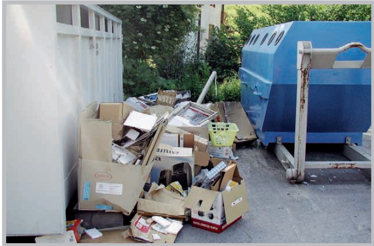
Heureusement, vous êtes nombreux à ne pas suivre cet exemple.