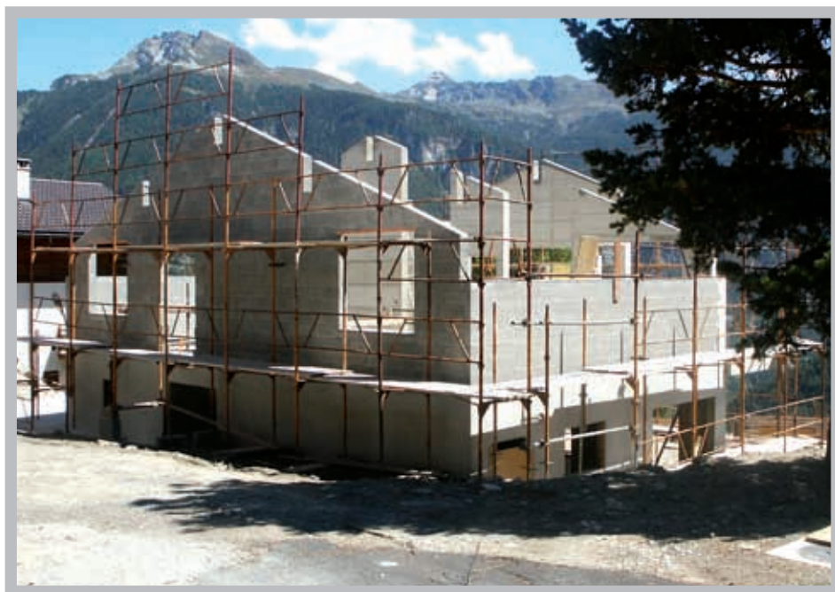
En 2006, nous avons autorisé plus d'une trentaine de constructions nouvelles.

Je rappelle qu'une autorisation de construire délivrée est une marque de confiance envers la personne concernée et que celle-ci se doit d'y adhérer de manière irréprochable. Comment en effet, dans le cas contraire, tolérer des commentaires négatifs envers les Autorités de la part de personnes peu scrupuleuses ou trichant sans aucune gêne. J'invite dans ce cas à renoncer aux rumeurs infondées mais à s'informer auprès de la source compétente. Egalement, avant toute modification, informer l'Autorité vaut mieux que d'agir pour ensuite souvent devoir renoncer à grands frais.