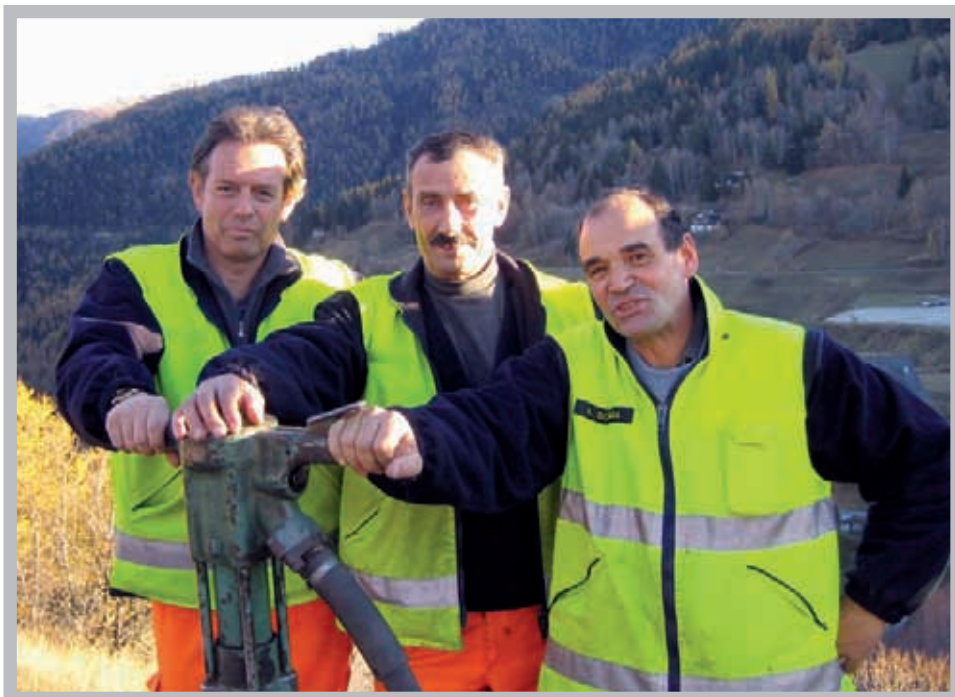
Nos employés des Travaux publics, une équipe qui prend soin de notre commune.

Cette organisation est obligatoire et a pour but d'intervenir sur des catastrophes naturelles et sous n'importe quelle forme, pour mémoire le débordement de la Dranse à Martigny a été mené par une cellule identique.