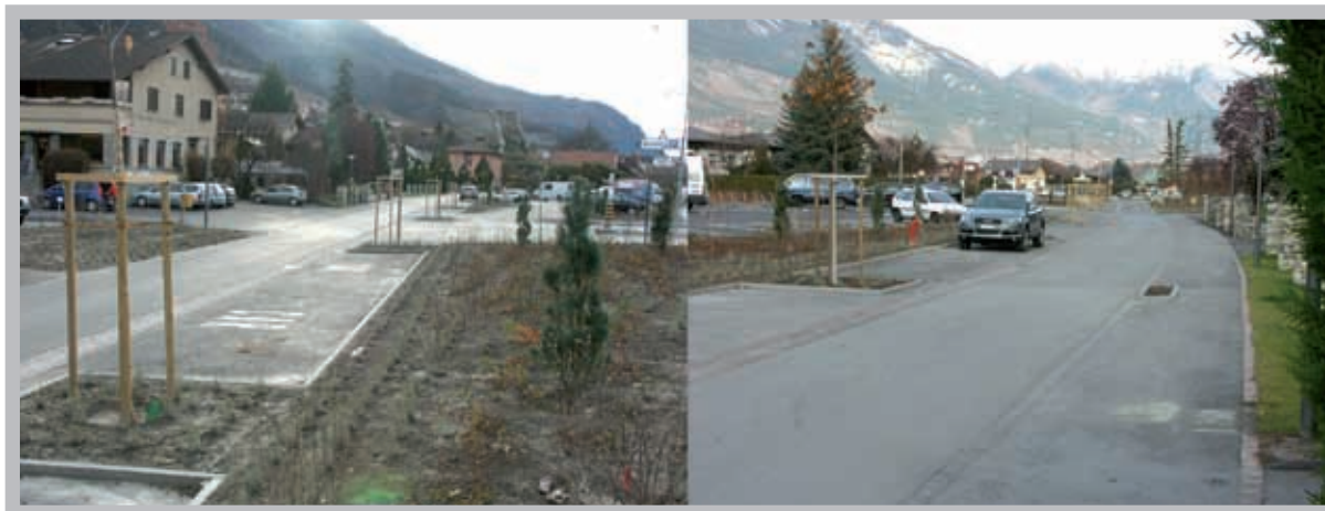
La réfection de la rue du Téléphérique contribue à rendre notre commune encore plus accueillante.