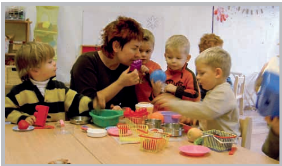
A la crèche "Les Jasmins", les enfants sont entre de bonnes mains.