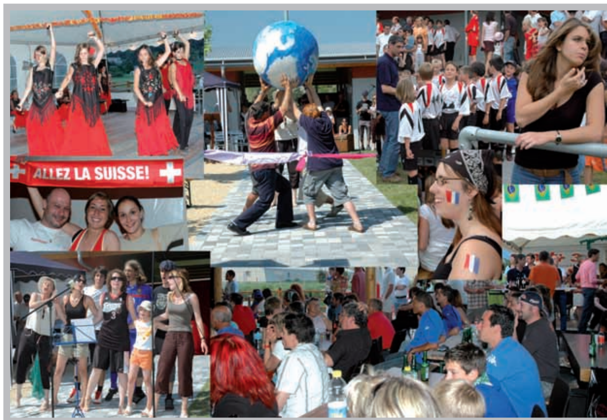
L'Espace Bozon en folie durant un mois. Une inauguration réussie, grâce à la participation d'un grand nombre de bénévoles (voir pag 11)