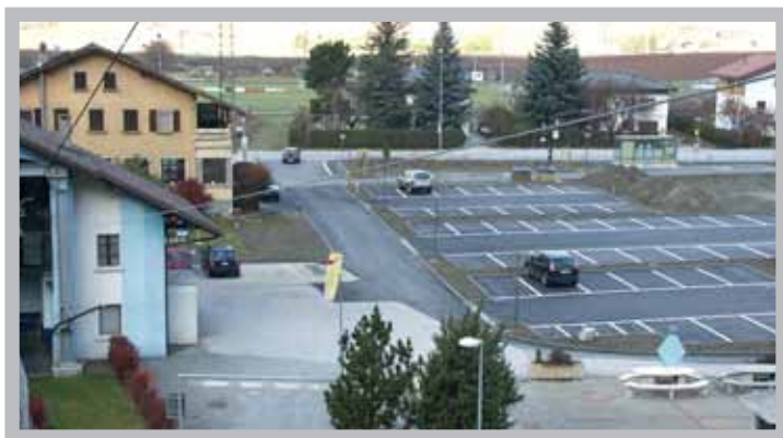
Il serait aisé de consacrer un module de ce parking pour les habitants de Vercorin désireux de profiter au maximum du téléphérique.