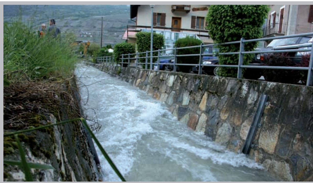
Pour prévenir les débordements, le lit de la Réchy sera assaini en 2007.

Ainsi, les investissements bruts s'élèvent à Fr. 2'114'000.- et les recettes d'investissements sont estimées à Fr. 424'000.-. Les investissements nets de Fr. 1'690'000.- sont donc couverts par la marge d'autofinancement de Fr. 1'859'010.- et l'excédent de financement de Fr. 169'010.- sera consacré à la réduction de la dette.