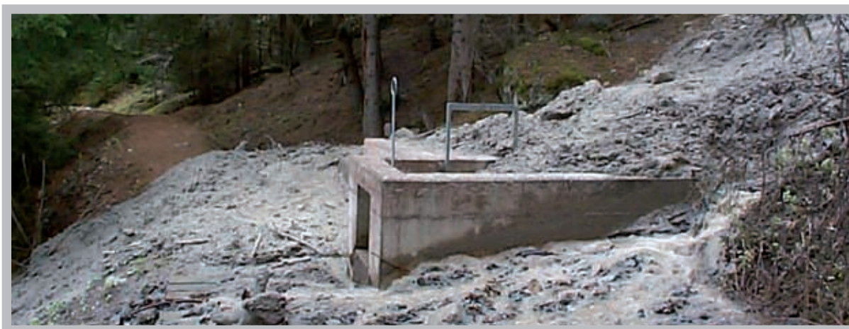
Durant les intempéries du mois de mai, la Déchendoua a provoqué un éboulement sur le bisse de Vercorin.

En fin de compte, les recettes s'élèvent à Fr. 10'881'555.-, les dépenses à Fr. 9'022'545.-, ce qui nous conduit à une marge d'autofinancement de Fr. 1'859'010.- et un bénéfice de l'exercice de Fr. 167'610.-.