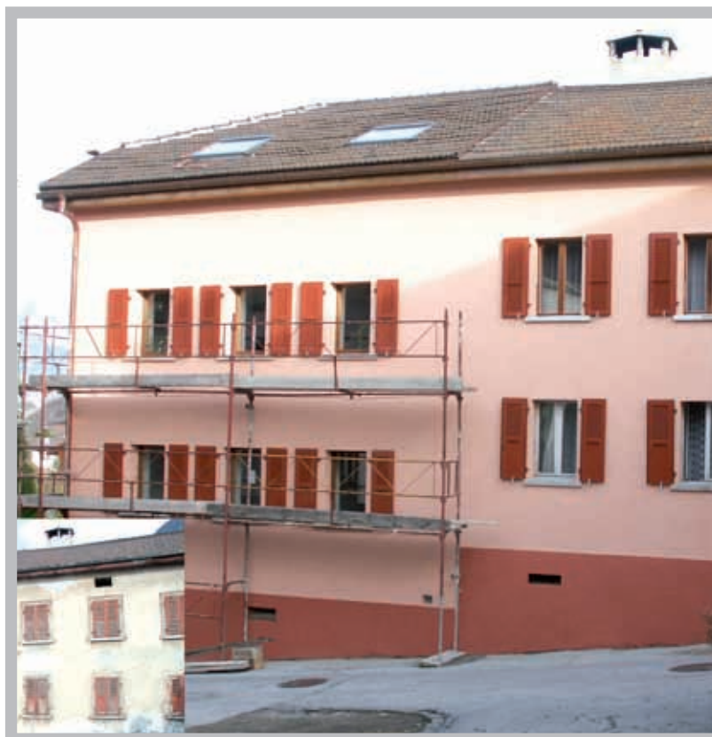
Un exemple de rénovation dans le quartier du Fuidjou.