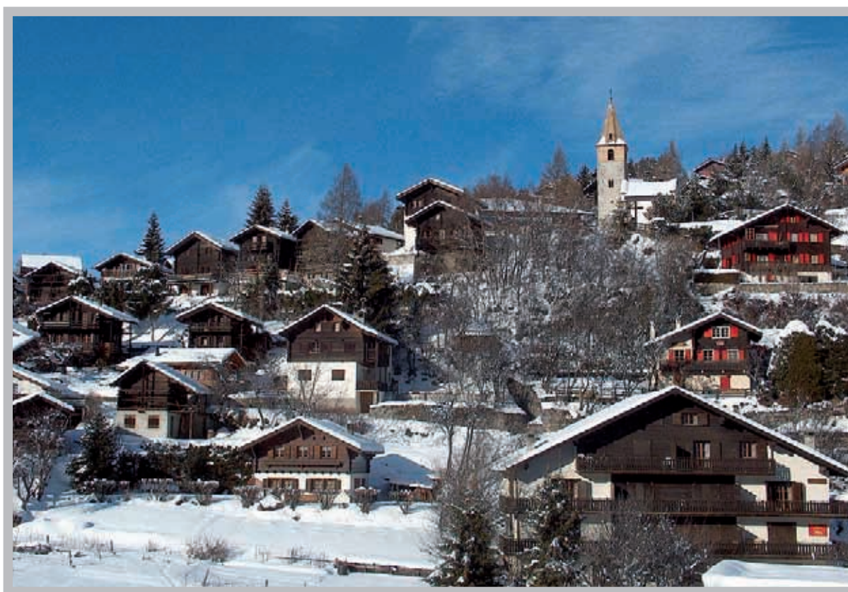
Les prix des terrains à Vercorin sont comparables à ceux pratiqués en plaine. Ce n'est pas le cas à Crans-Montana.