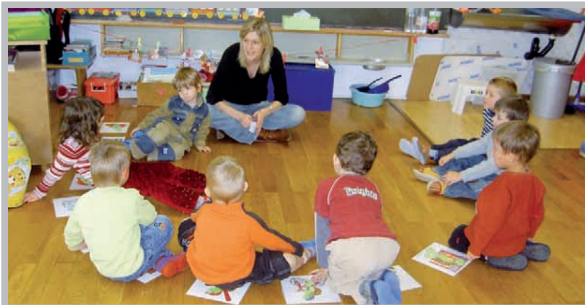
Bientôt, les enfants pourront jouer dans des locaux mieux adaptés et plus vastes.

partage tout en pouvant compter sur le soutien de l'adulte. L'équipe se veut donc disponible et à l'écoute des envies du groupe. Des activités sont proposées par les éducatrices; les enfants y participent selon leur envie, ceci afin d'encourager leur créativité et développer le sens des activités collectives.