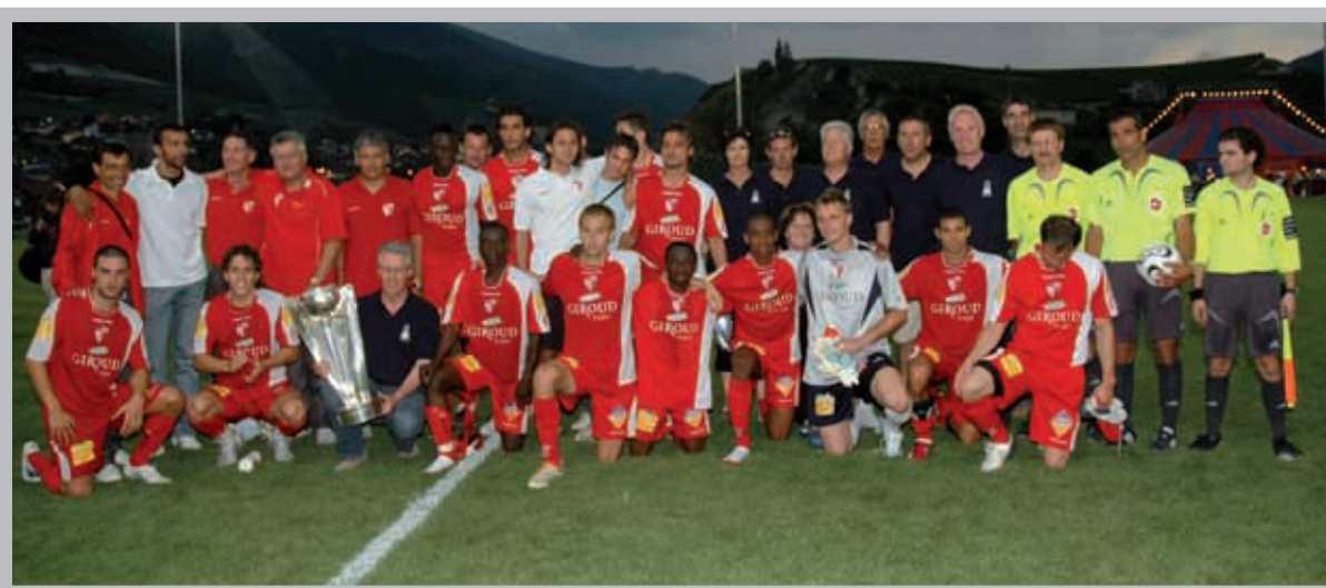
Le FC Sion avait apporté la Coupe Suisse pour inaugurer le nouveau terrain de football de Bozon.