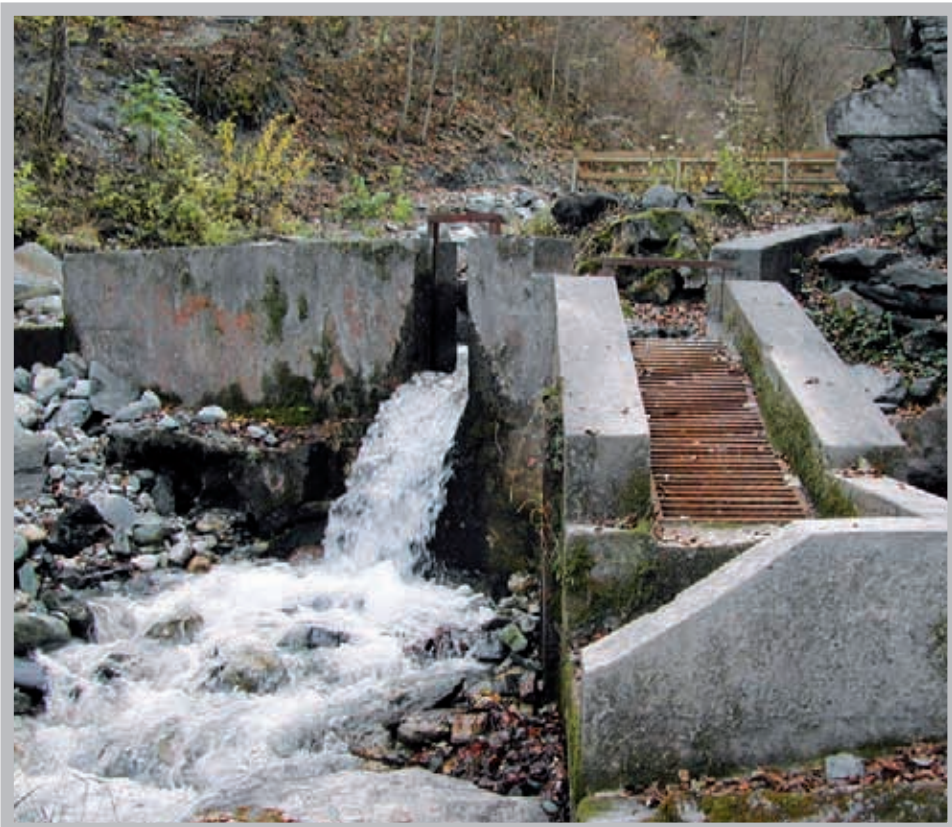
Les bisses sont les éléments essentiels de notre réseau d'irrigation.

Notre commune dispose d'un important réseau d'eau potable, prenant sa source dans le Vallon de Réchy. Cette année, le réglage adéquat des divers réservoirs effectué par le système de télégestion a eu comme avantage notable non seulement d'éviter le gaspillage, tout en permettant à la population de faire face à ses besoins, même pendant les périodes de forte chaleur estivale.