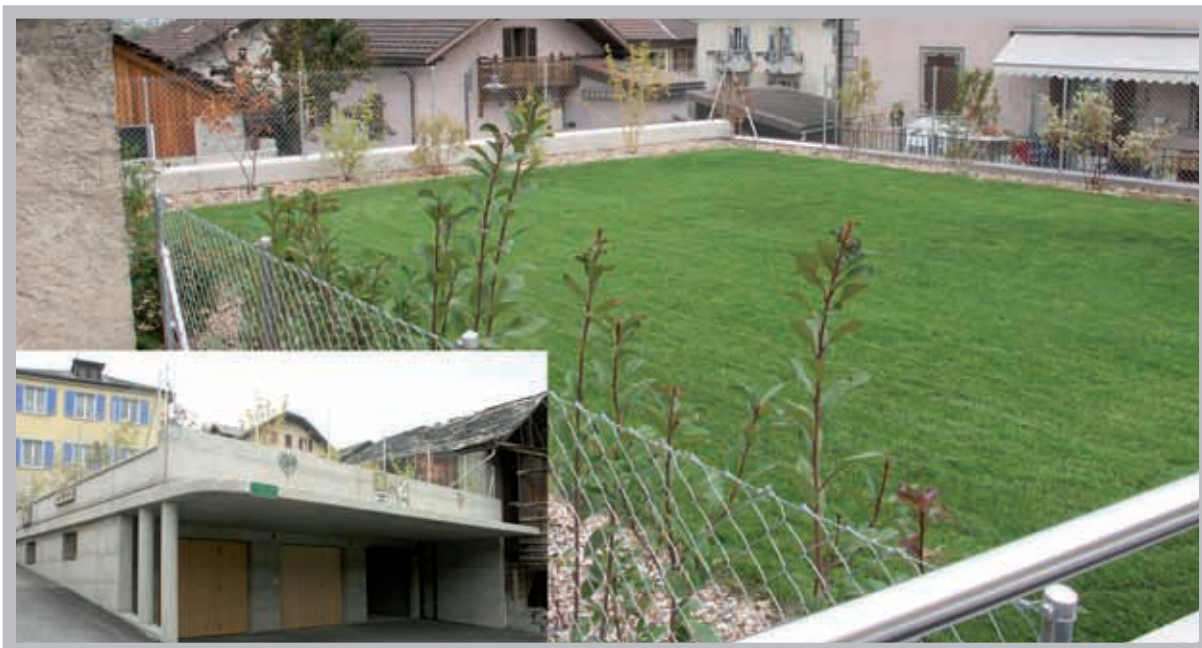
L'aménagement de La Forge, un espace de verdure bienvenu au coeur de Chalais.