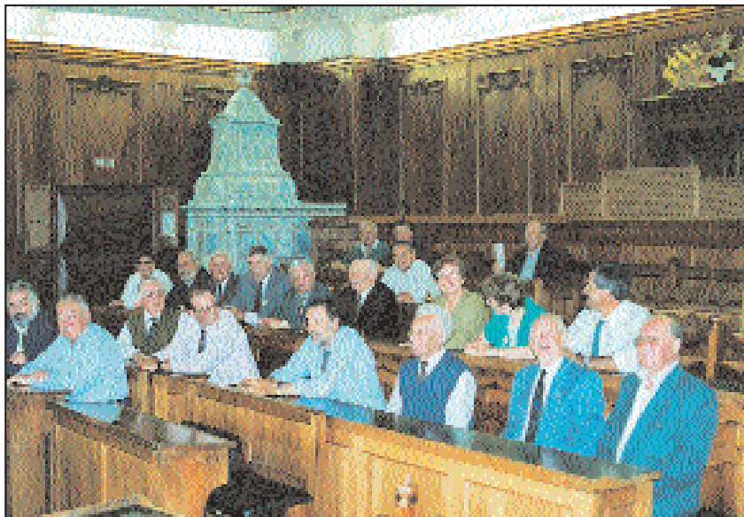
Les magistrats de notre Commune reçus dans le Parlement fribourgeois.