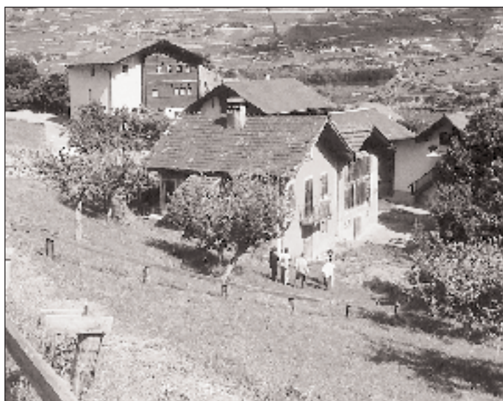
Parcelles de Pernet, à proximité de la maison bourgeoise.

En cas d'acceptation, le Conseil se propose