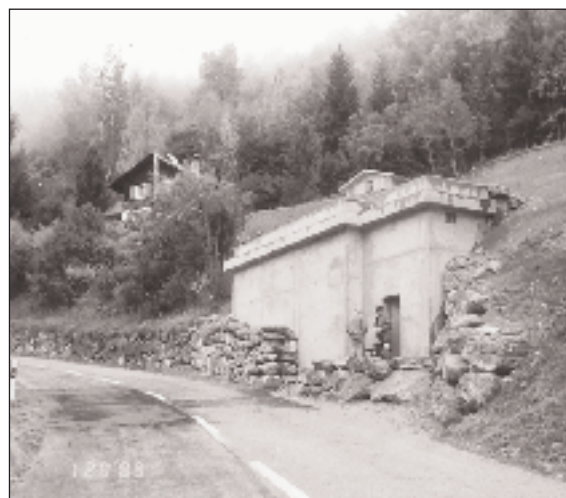
Réservoir des Tsabloz, sur la route d'Itravers-Vercorin.

La mise en service du réseau, à notre entière satisfaction, a été effectuée au mois de septembre 1997 et la réception de l'ouvrage le 15 octobre 1997.