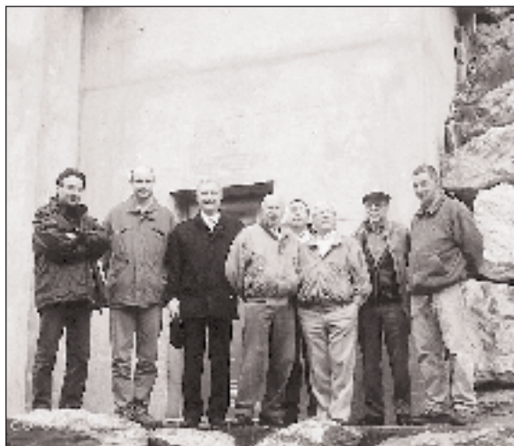
Réception de l'ouvrage le 15 octobre 1997.