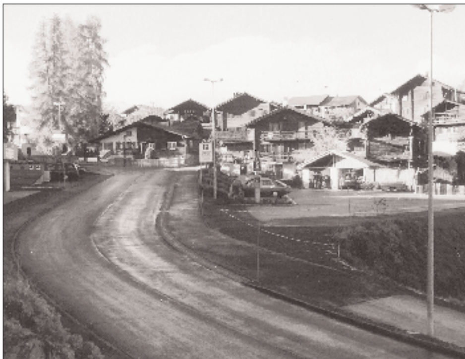
Entrée de Vercorin: une modification appréciée.