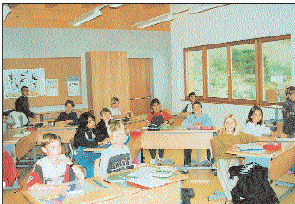
La classe de 5 e et 6 e primaire de l'école de Vercorin.

Pour alléger la classe de 6e primaire de Chalais, 4 élèves de la plaine ont choisi de fréquenter l'école de Vercorin.