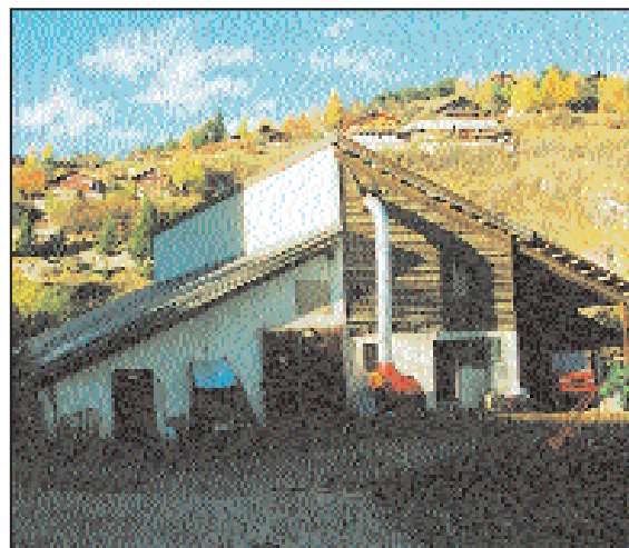
Contrat de l'étable communautaire renouvelé.