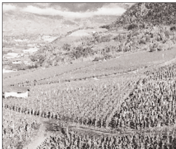
Domaine du Perrec.

Depuis quelques années, le Conseil communal essaye de sensibiliser nos marchands de vin et ceux de la région pour mettre sur le marché, un vin rouge sous l'appellation de Pinot de Chalais. Cette démarche s'inscrit dans le souci de défendre notre vignoble de la rive gauche et de prouver si besoin était, que nos cépages de rouge sont de grande qualité. Les contacts avec la maison PROVINS ont été fructueux et ont abouti, le lundi 20 octobre à un accord de principe.