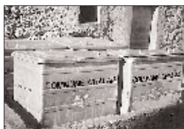
Des coûts toujours plus élevés

Seule la participation plus importante des utilisateurs du service nous paraît raisonnable, en fonction également du principe de l'utilisateur-payeur.