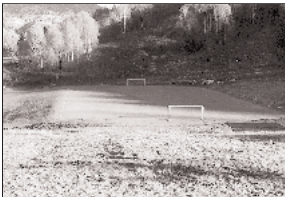
Terrain de football du Lavio.