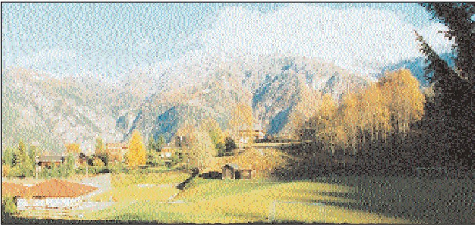
Aménagements au Creu du Lavio à Vercorin.