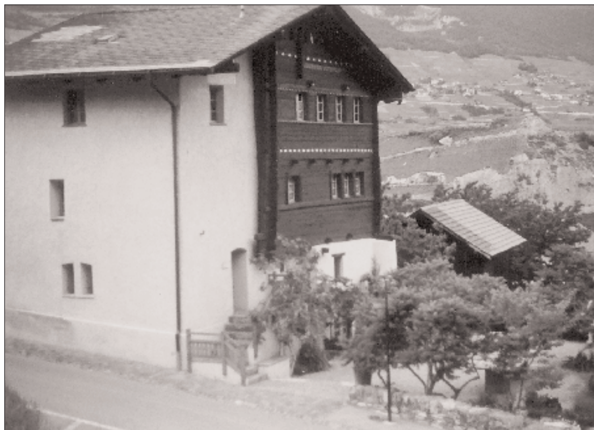
Une maison bourgeoise toujours bien fréquentée.