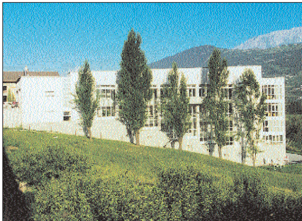
Home de Chalais